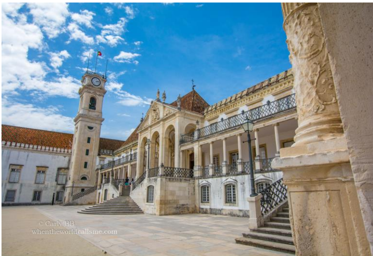
Univerzitet u Koimbri, Portugal