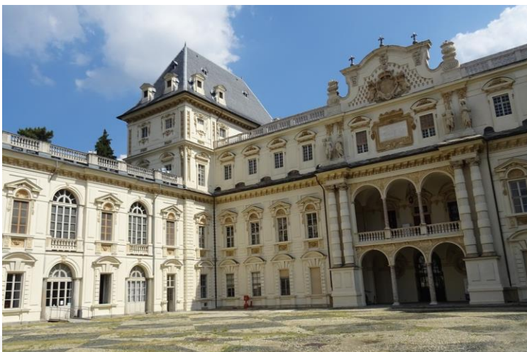
Univerzitet u Torinu, Italija